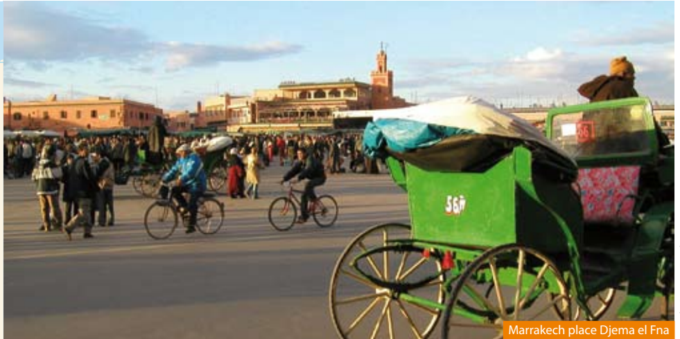
Marrakech place Djemaa el Fna