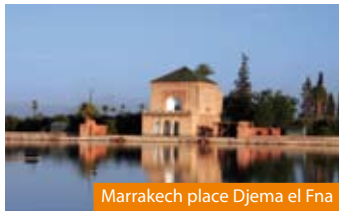
Marrakech place Djemaa el Fna

Visite de la capitale touristique du Maroc : la Koutoubia (de l'extérieur), le Palais de la Bahia , les tombeaux Saadiens , la place Djemaa El Fna . ✕. Visite avec les jardins de l' Aguedal jouxtant le Palais Royal , la Ménara . Découverte des remparts, des souks. ✕. Soirée marocaine . ✕.